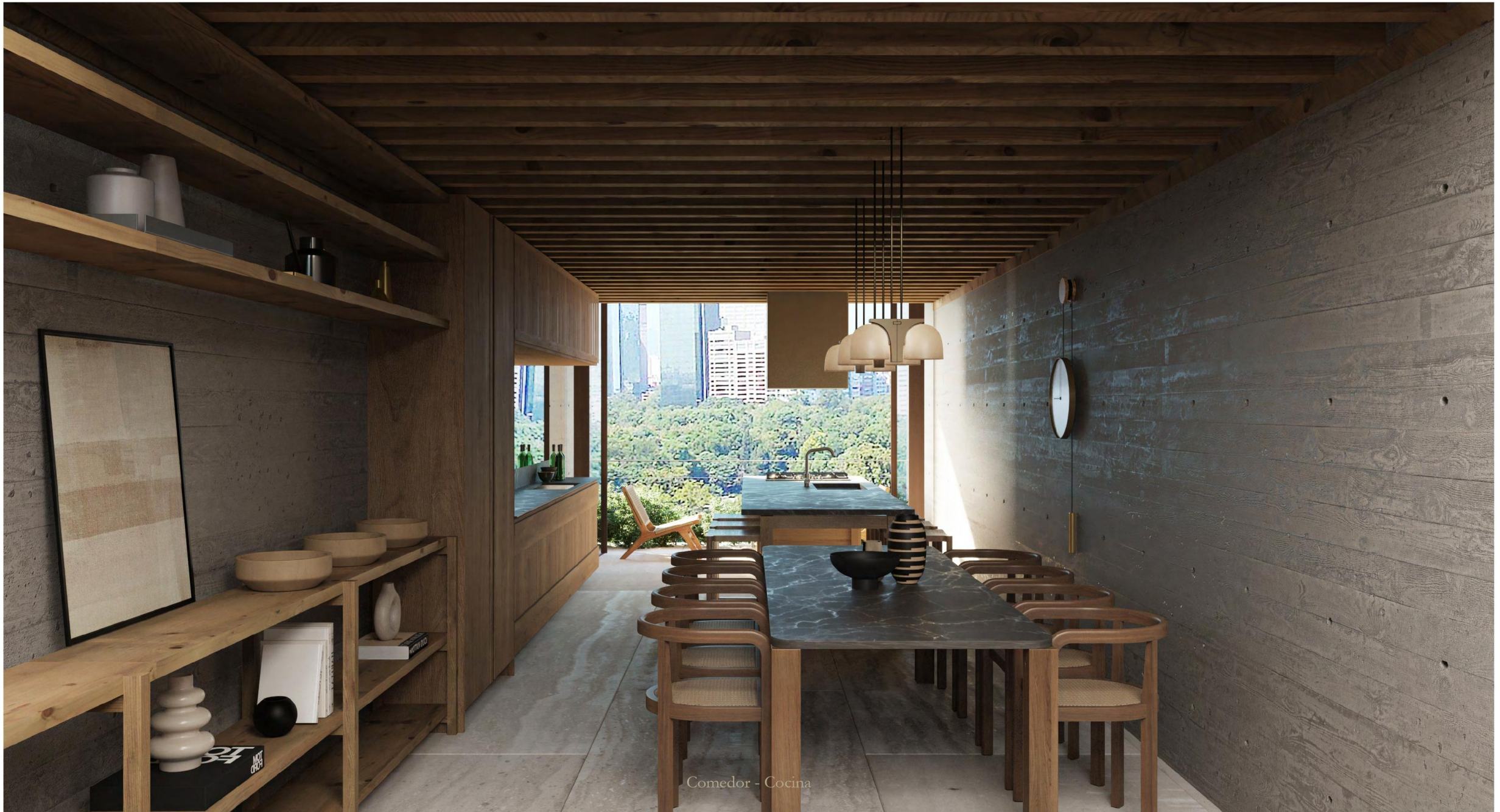
Comedor - Cocina