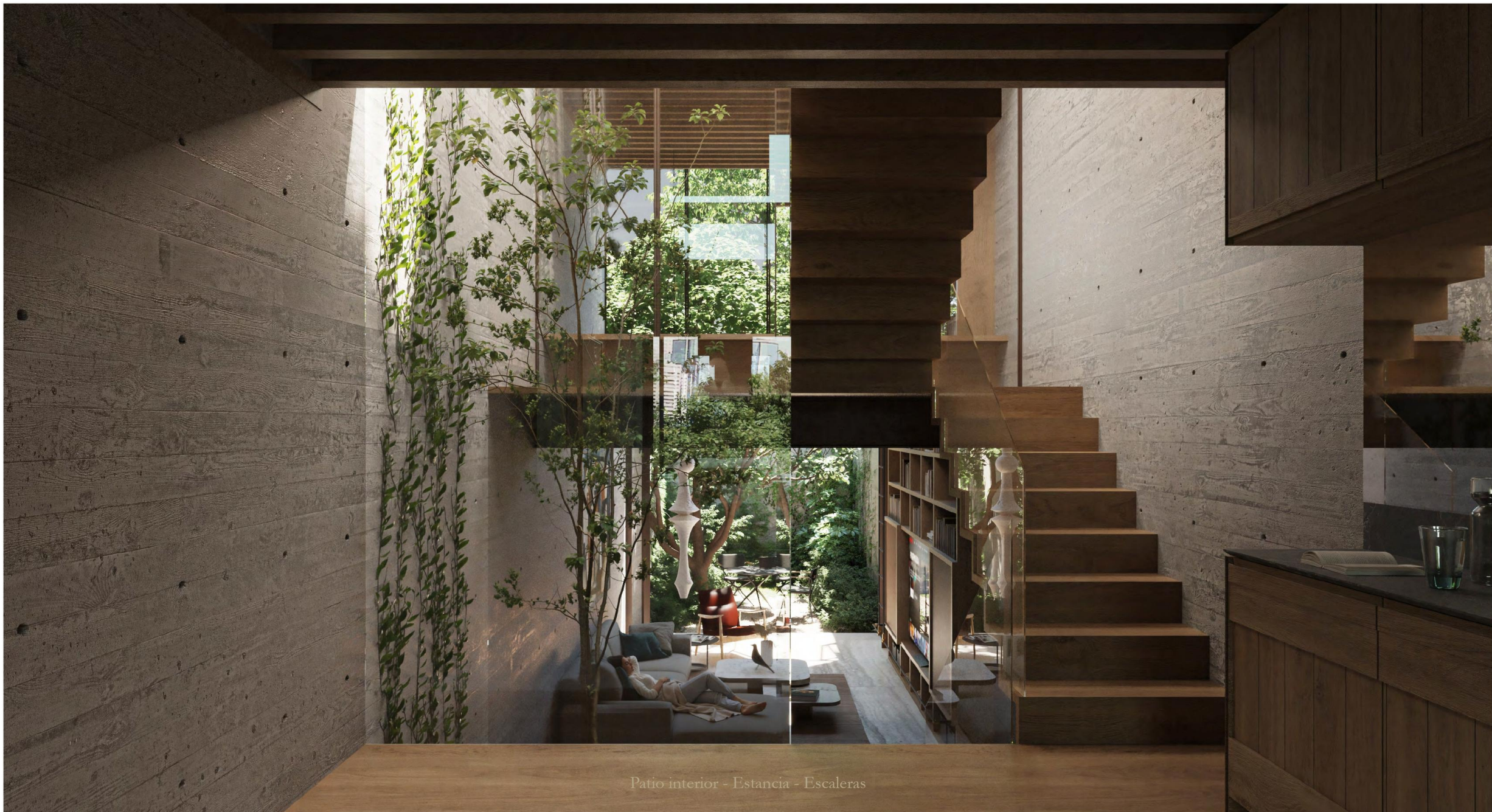
Patio interior - Estancia - Escaleras